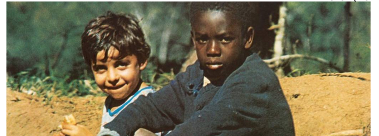
Clássico: 'Clube da Esquina' é o trabalho mais bem avaliado