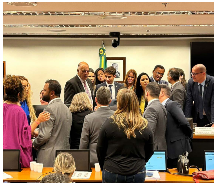
Deputados levantam questões religiosas contra casamento igualitário

A sessão foi encerrada sem apreciação do mérito da pauta e postergada a votação para a próxima quarta-feira, 27, um dia após a realização da tão esperada audiência pública.