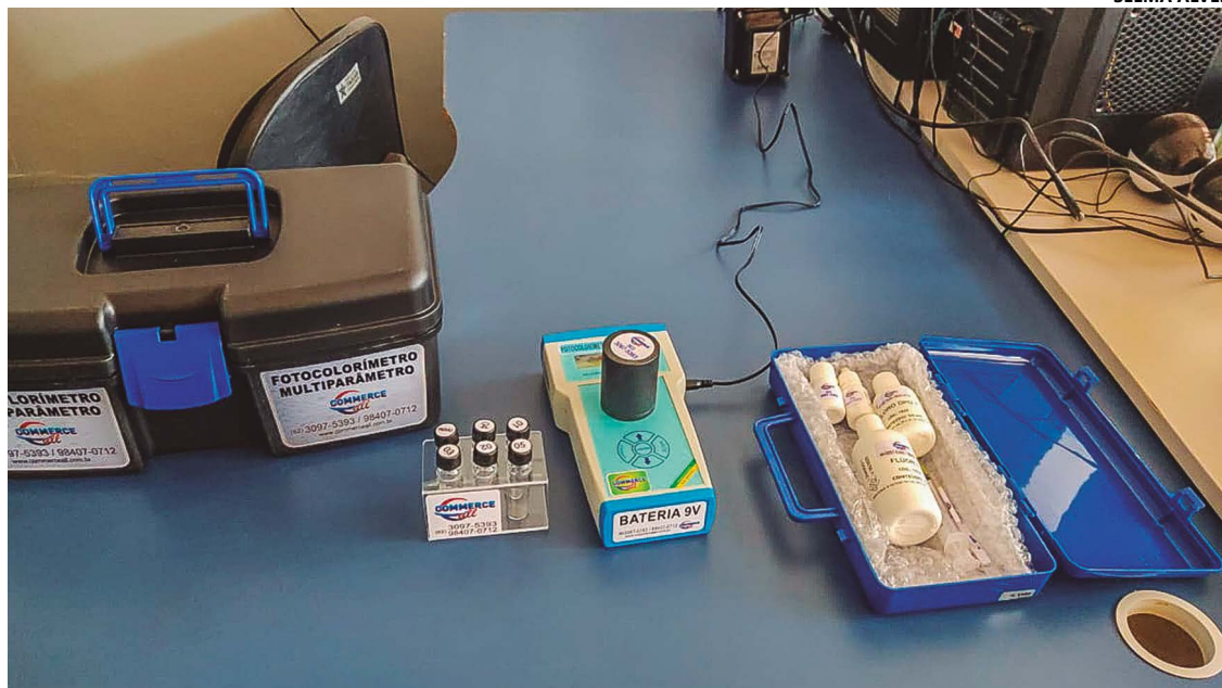
Kit compelo com os equipamentos que serão utilizados para realizar as análises e o monitoramento da água

“O que nós precisamos, já com o recurso repassado, é que os municípios iniciem o processo de compra desses equipamentos e insumos para que a gente possa melhorar o monitoramento e a qualidade da água utilizada no estado”, destacou. O programa