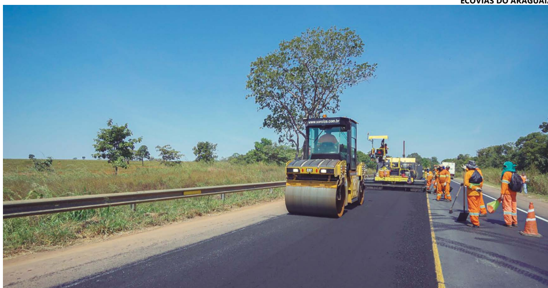
ECOVIAS DO ARAGUAIA

Durante a execução dos serviços, ocorrerá a circulação alternada, com o sistema 'pare e siga',