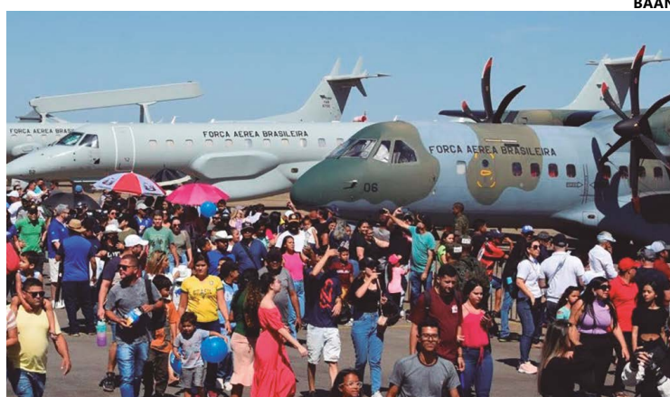
Segundo a Força Aérea, 55 mil pessoas estiveram na edição deste ano

Houve exposição estática de aeronaves civis e militares, de