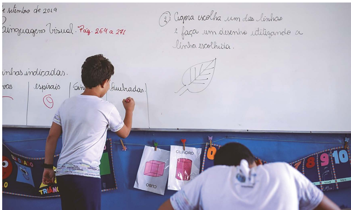
Anápolis tem mais de 100 escolas e atende cerca de 37 mil alunos, com um contingente de 5 mil profissionais

Outro ponto destacado pelo secretário foi a fragilidade em que as famílias estavam inseridas durante a pandemia, com a perda do poder aquisitivo, muitas crianças migraram da rede privada para pública. No entanto, a pasta acre-