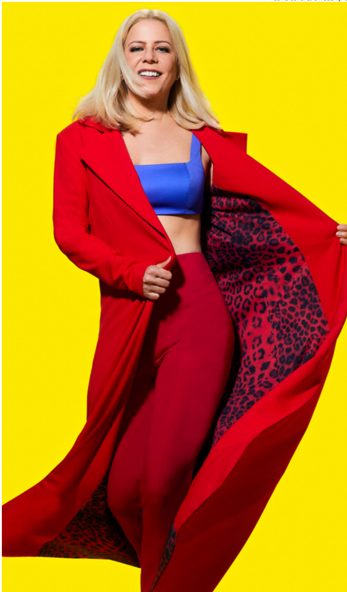
Eu quero você, como eu quero: cantora promete espetáculo com clássicos e nova canção