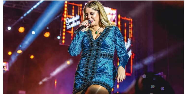
Rainha do feminejo: artista quebra barreiras mesmo sem estar entre nós